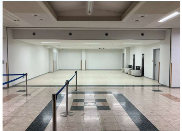
改修後の出発ロビー