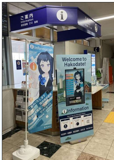
▲案内所設置イメージ

北海道エアポートではAIの活用を推進し、お客様のニーズに応じて快適にご利用いただける空港を目指してまいります。