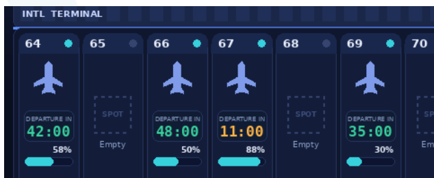
▲国際線全8スポットの状況可視化画面 (イメージ)

運航スケジュールの乱れが生じやすい冬季等において、多様な航空会社が乗り入れる国際線で本システムの導入効果を期待しており、当社では今後も最新のAI技術を活用し、空港運用の効率化と需要が増大する国際線の受入体制の強化に取り組んでまいります。