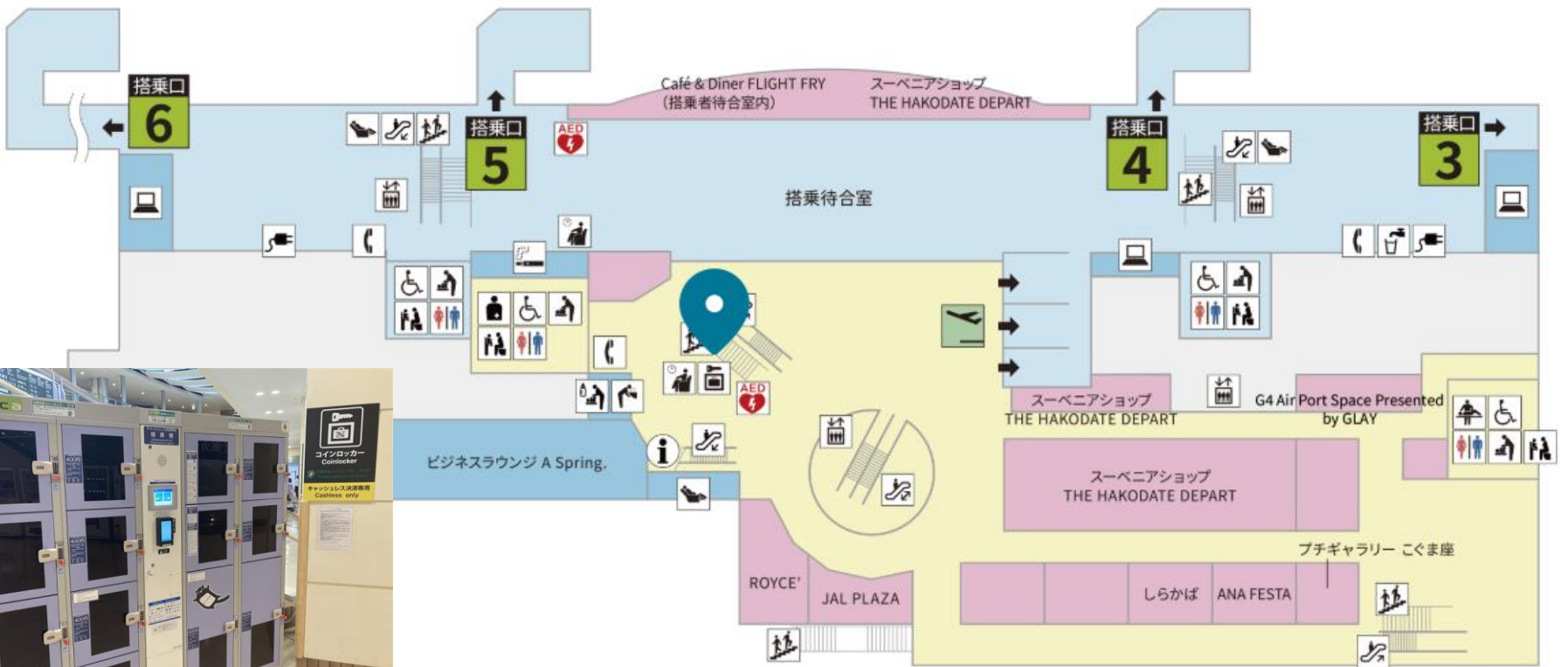
函館空港 国内線 2F