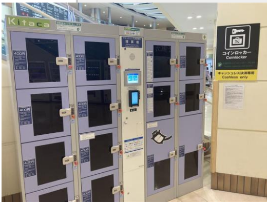
函館空港 国内線 1F