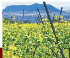
Riccardo Tossani Architecture Inc.

ワイン通ならだれもが知る、 フランス・ブルゴーニュの 名門ワイナリーが函館市西部の土壌と 気候に惚れ込み、日本で初めて参入。 2023年から本格的な収穫がスタート。