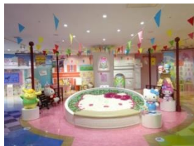
●ハローキティ ハッピーフライト

旅客ターミナルビル内には、道内各地の特産品や人気の北海道スイーツをはじめ北海道グルメや伝統工芸品など、約190店舗に北海道の魅力を集約しております。更に、他空港にない取り組みとして、大型エンターテインメント施設を展開することにより航空旅客のみならず、地元地域の皆様にも楽しんでいただける時間消費型・滞在型の空港を目指しております。