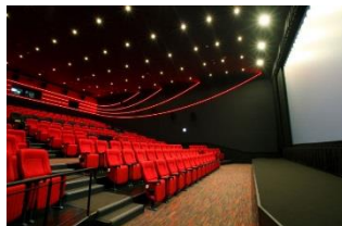
●新千歳空港シアター